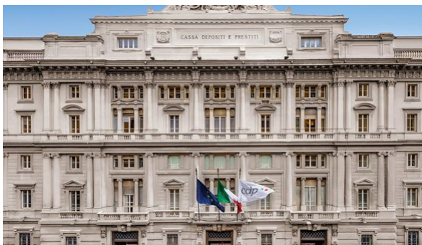
Andranno a favore di 13 PMI campane. Cassa Depositi e Prestiti e Mediocredito Centrale anchor investor dell'operazione